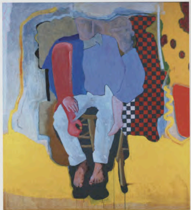
Le Roi de rien III

Considérer le monde contemporain «comme une aventure que nous devons construire tous ensemble», tel est pourtant son motto. «Mais ce qui manque aujourd'hui, c'est cette confiance en l'aventure. L'imaginaire, lui, est là», ajoute ce passionné d'Albert Camus et Walter Benjamin. L'art, bien sûr, a son rôle à jouer dans le processus. «Il nous signale les contradictions du monde contemporain, car le poétique est politique, il n'est qu'à lire Hölderlin ou Rimbaud pour l'envisager. Nous, les artistes, ne voyons pas plus que vous, mais nous donnons forme, nous matérialisons ces visions. Pas de quoi frimer», conclut-il dans une moue amusée. Désireux de ne surtout pas faire d'explications de texte de ses toiles, sculptures ou néons, il accepte tout juste de dévoiler de rares