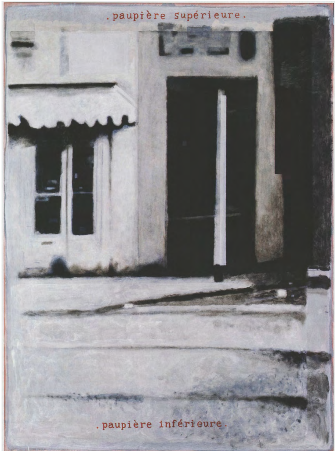
La Vision des habitants de Watts en 1965, I

Paupière supérieure, paupière inférieure. Soit une série de toiles mettant en abîme la question du regard. Toujours concerné par les questions sociétales, le peintre s'inspire ici des émeutes raciales de Los Angeles, dans le quartier de Watts, en plein combat pour les droits civils. Mais il a aussi réalisé une toile à partir des récentes émeutes de Ferguson.