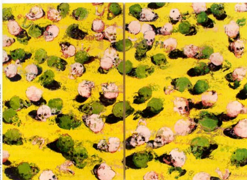
Philippe Cognée, Vanité 2 , 2006, peinture à la cire sur toile, diptyque.

Philippe Cognée , par Christian Bernard, introduction Henry-Claude Cousseau, éditions Daniel Templon, Paris, 2009.