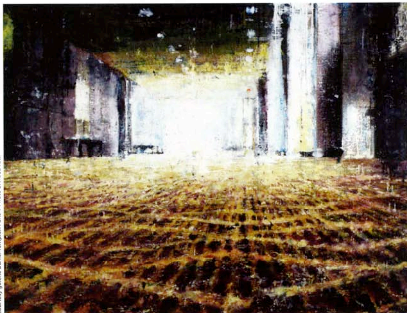
Philippe Cognée, Couloir d'hôtel à Tokyo , 2009, peinture à la cire sur toile, 150 x 200 cm.

photographie, filme notre environnement en en saisissant des fragments, utilise des caméras et des ordinateurs, dont même les « bugs » sont source de création ! De plus, le peintre a le talent