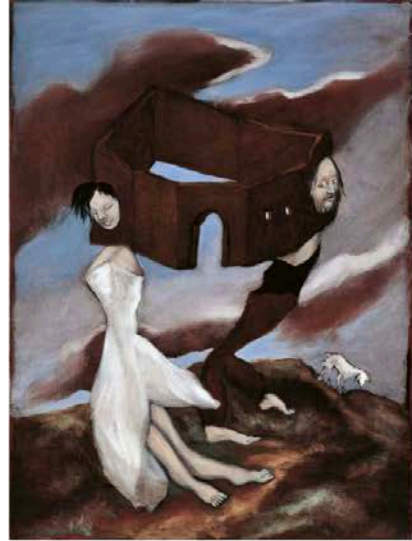
© ADAGP Paris, 2018 / Jp photo Adam Ropke

cueillir par lui, elle se fond dans l'huile de la peinture. Elle nous invite à rentrer dans ce monde mouvant, ce monde qui me plaît. L'esprit se tait, il peut enfin galoper. Je me régale, c'est magnifique. Je me promène encore un moment dans cet univers de peinture qui possède sa propre cohérence, peuplé de symboles sans doute universels, mais qui