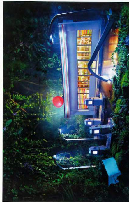
Gas Ampm (Station-service Ampm), 2013