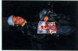
David LaChapelle avec le Photo magazine n° 457 du mois de mars 2009.

Tu as réalisé la carte de vœux 2014 de la famille Kardashian pour les fêtes de Noël ? Les Kardashians avaient déjà posé pour moi. Cette année, je disposais d'un peu de temps. Ils ont été très généreux et m'ont laissé libre de ma création. D'un côté, ce projet allait dans le sens de mon besoin de capturer la culture contemporaine actuelle, de l'autre, cette famille a besoin de séduire. C'est une expérience formidable.