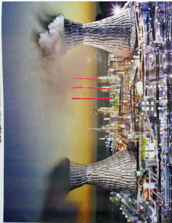
Land Scope Paysage / Pacific Society, 2013

Elles parlent de mépris de l'environnement, de surconsommation et d'énergies fossiles, n'est-ce pas ? Elles parlent du plus grand événement de l'histoire humaine, l'événement le plus lourd de conséquences que l'être humain ait imaginé — plus important que toutes les religions, que les guerres, que n'importe quelle