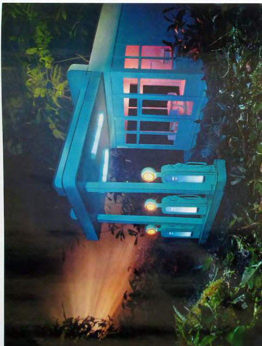
Gas 76 (Station-service 76), 2013