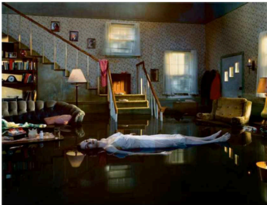
Untitled (1999-2002).