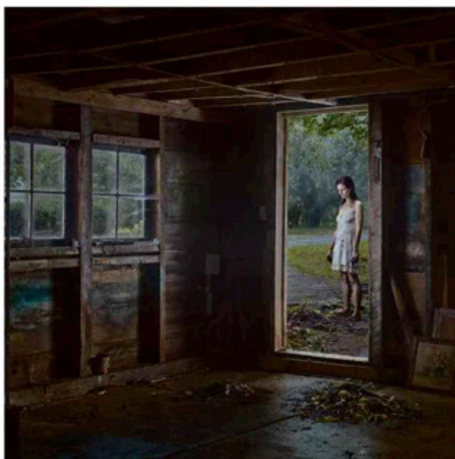
The Shed (2013). Dimensions : 95,3 x 127 cm.

Rencontre avec le photographe américain dont les mises en scènes inquiétantes ont influencé des dizaines de cinéastes et réalisateurs de séries, à l'occasion de la présentation de son nouveau travail, à Paris.