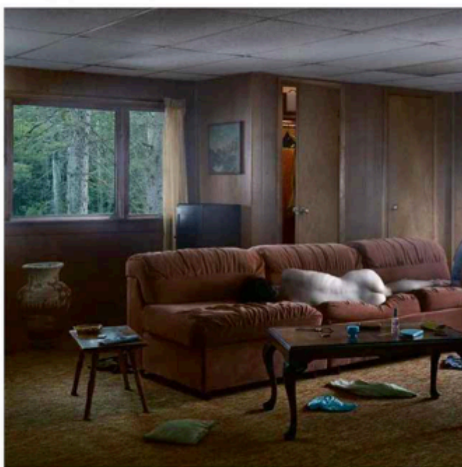
The Den (2013). Dimensions : 95,3 x 127 cm.