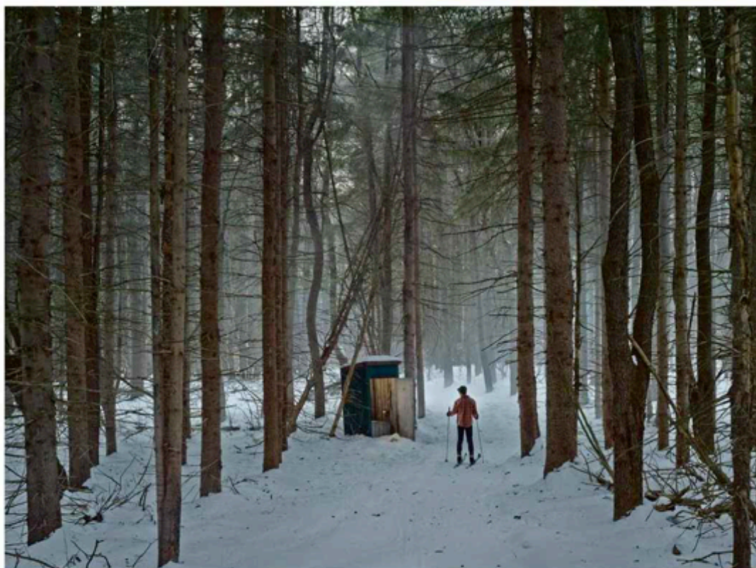
Cathedral of the Pines (2014) de Gregory Crewdson. Dimensions : 95,3 x 127 cm.

Gregory Crewdson dans la brume magnétique