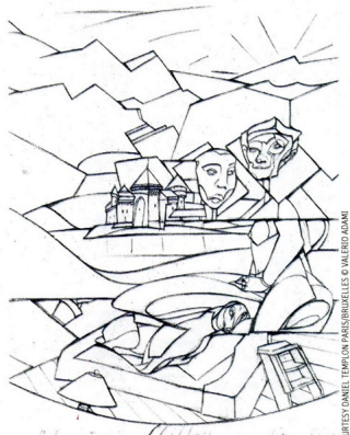
Valerio Adami, "Il castello Chillon", 2008, crayon sur papier, 48 x 36 cm.

Pour faire naître une peinture, Valerio Adami, peintre majeur au panthéon de l'art contemporain, dessine énormément, "de manière spontanée, précise-t-il, le point entraîne la ligne qui donne l'horizon et puis la forme se met à exister. La verticale est celle du corps humain qui