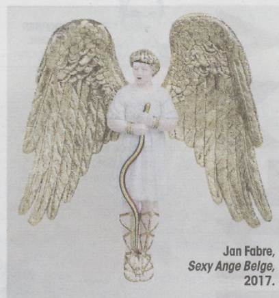
Jan Fabre, Sexy Ange Belge , 2017.