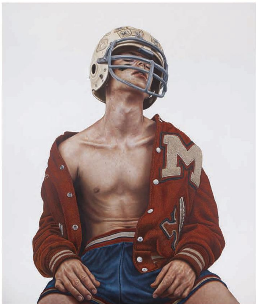
Resist , THE KID, 2017, Painting, Oil and egg tempera on canvas, 242 x 211 x 6 cm., 95 1/4 x 83 x 2 1/3 in. Le Grand Palais, Paris, France, 2017

Drie schilderijen — The Future Is Old , I Saw The Sun Begin To Dim en Marvin — en een paar van mijn sculpturen. Ik wil het publiek bevragen over sociaal determinisme, kansenongelijkheid, de dunne scheidslijn tussen onschuld en ontarding en het vervagende besef van goed en fout in onze moderne samenlevingen. Kunstenaars van wie het werk permanent tentoongesteld wordt in Moco, van Warhol en Basquiat tot Banksy en Kaws, hebben allemaal van kinds af aan een grote invloed op me gehad. Ik ben trots dat ik daar straks tussen mag staan.