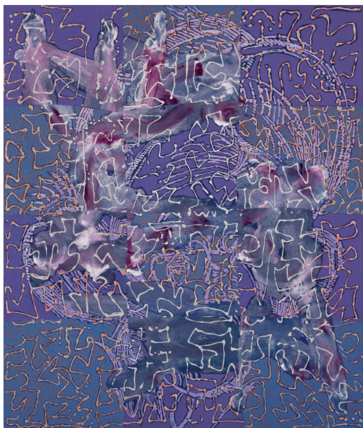
Odalisque Flandres XVII , 2011, Peinture à la cire sur toile tressées 169,5 × 145 cm © Courtesy Templon, Paris – Brussels – New York.