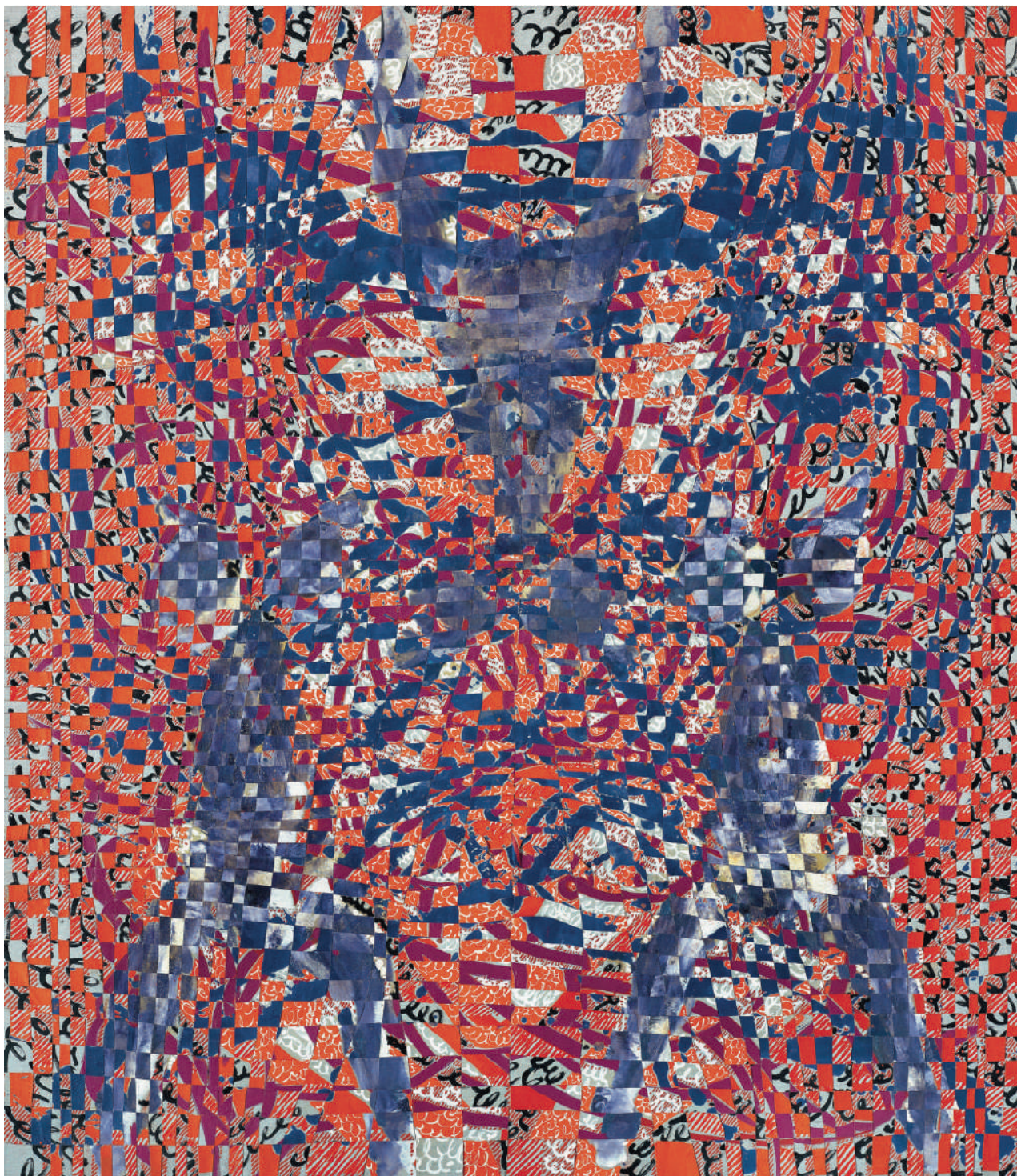
Odalisque Flandres XVI, 2010 – 2011 Peinture à la cire sur toile tressées 171 × 149 cm

C'est comme si vous aimiez les grandes blondes et que vous tombiez amoureux d'une petite brune... Il n'y a aucun rapport entre son travail et le mien, et pourtant! ... quel artiste ! Il me disait : « Toi et moi c'est pareil, mais évidemment tes petits carreaux c'est plus facile ! » Je lui répondais : « Ok, mais toi et tes petites filles, avoue que c'est quand même plus marrant à peindre que mes petits carreaux ! ». Balthus méprisait les artistes