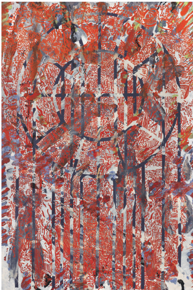
Chambre Siena III, 2013 – 2015, Peinture à l'huile sur toiles tressées. 300 × 200 cm.

en tête cette phrase de Cézanne, « Je vous dois la vérité en peinture et je vous la dirai ».